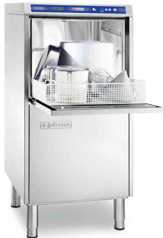
D 120 DGT