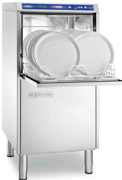
D 85 DGT