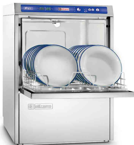
D 45 DGT