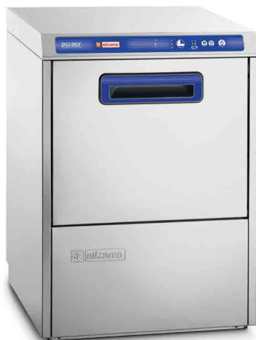
D 36 DGT